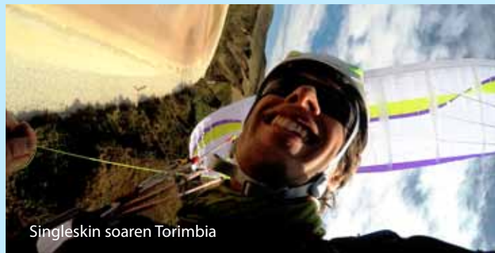
Singleskin soaren Torimbia

Het soarstrand Sopolana heeft verschillende startmogelijkheden en vliegt het best bij een noordwestelijke windrichting.