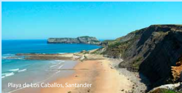
Playa de Los Caballos, Santander

Een snel en voordelig alternatief voor de circa dertien uur durende autoreis naar de Spaanse noordkust is het vliegen naar de Baskische hoofdstad Bilbao. Een retourtje met de KLM cityhopper inclusief paragliding bagage kost gemiddeld € 150,-. Op de luchthaven van Bilbao kan tegen een gunstig tarief een auto worden gehuurd. Voor een stektentocht van minimaal vijf dagen kan de trip logistiek gezien prima worden opgeknipt in drie of vier delen, met als eerste uitgangspunt Llanes, vervolgens Santander en/of Bilbao en tot slot