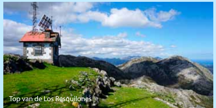
Top van de Los Resquilones

GPS La Picota: N 43° 26' 50" / W 3° 56' 31" (technische startplaats)