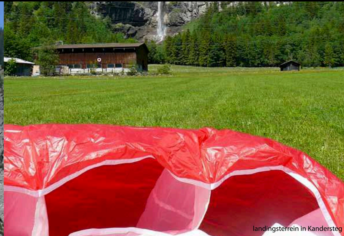
landingssterrein in Kandersteg