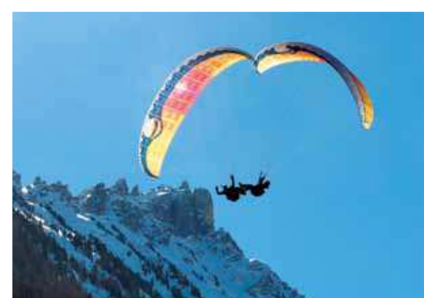
Tekst: Peter Blokker