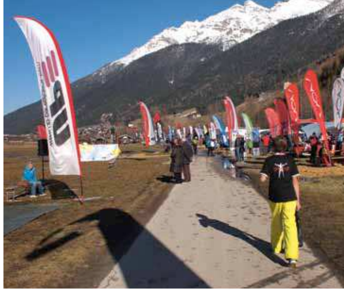
Fabrikanten laten hun nieuwe materiaal zien op de outdoor beursvloer