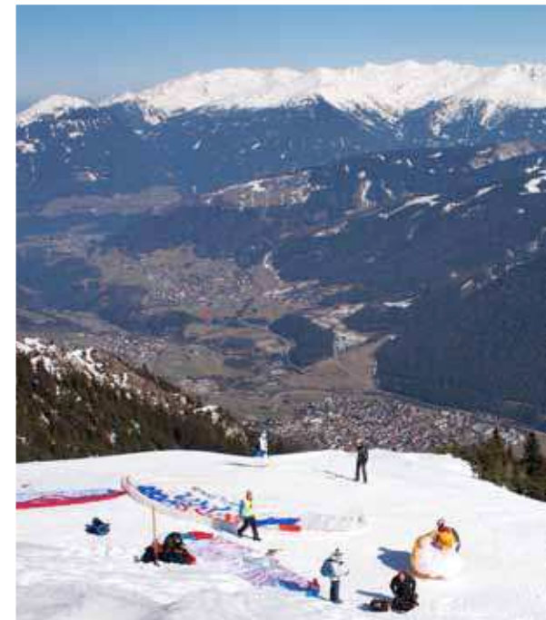
Foto boven: Startplek Kreuzjoch bij het topstation van de Schlick 2000. Foto onder: Het Team Freestyle laat zijn stunts tot groot vermaak van het publiek ook op lage hoogte zien.

Startplek bij het topstation van de Elferlift.