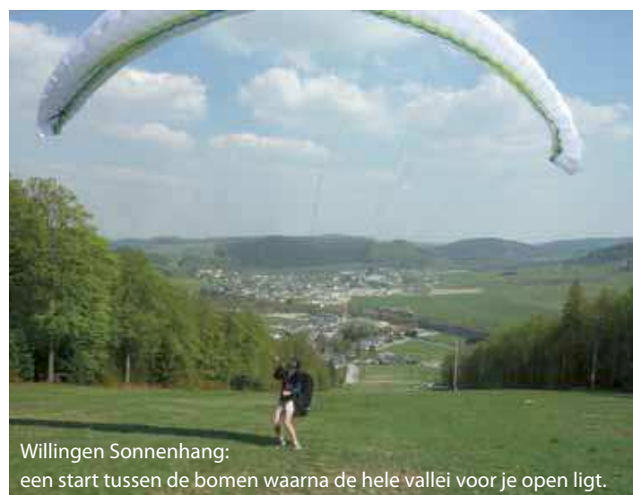
Willingen Sonnenhang: een start tussen de bomen waarna de hele vallei voor je open ligt.

de start te rijden bij de Vis-à-Vis hütte naast de landing. De Sonnenhang is een oosthelling, dus vooral geschikt voor vroege vogels zou je denken. De zon staat inderdaad al vroeg op de start en de thermiek werkt soms al om 10 of 11 uur. Maar bereid je dan voor op scherpe, kleine bellen. Het is schrapen boven de bomen of de huizen onderaan de helling. De mooiste vluchten maakte ik hier toch tegen het einde van de mid-