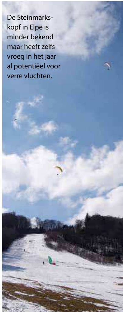
De Steinmarkskopf in Elpe is minder bekend maar heeft zelfs vroeg in het jaar al potentiëel voor verre vluchten.

Minder bekend dan Stüppel, maar met flink wat potentiëel voor afstandvliegen is de huisberg van vliegschool Papillon in Elpe. Naast de landing is de winkel en vliegschool gevestigd. Er worden hier regelmatig barbecues gehouden en als je je van te voren meldt kun je voor een minimale bijdrage met je camper op de parkeerplaats van de vliegschool overnachten. De start bereik je door omhoog te lopen of mee te rijden (voor een kleine bijdrage) met een van de schoolbusjes. De startplek bevindt zich tussen de bomen, dus bij zijwind kun je rekenen op een turbulent momentje zodra je boven de bomen uitkomt. Thermiek vind je links of soms rechts boven de bomen. Zodra