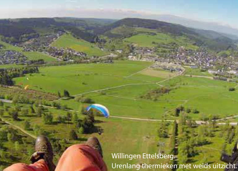
Willingen Ettelsberg. Urenlang thermieken met weids uitzicht.

Goedkoop is die niet (je kunt wel een dagkaart kopen voor als je de bel mist en na twee minuten weer beneden staat) en lopen gaat over het slingerpaadje links van de starthelling prima. Parkeer de auto beneden bij de lift of wat hoger op vlak bij het Berggasthof Zum Wilddieb. De start is niet helemaal bovenaan de lift (daar is het niet steil genoeg) maar bij de windvaan. De thermiek zit vaak links boven de bomen of gewoon recht voor de start. Vlieg niet laag over de liftbaan rechts van de start maar houd minimaal 50 meter afstand in hoogte. Je kunt kiezen uit twee landingsplaatsen: het grote veld rechts van de lift wat verder naar onderen is mooi vlak maar heeft als nadeel dat je over de lift moet vliegen en dus voldoende hoogte nodig hebt. Let ook op dat je niet over het wildpark vliegt. Recht onder de start ligt het meest praktische landingsveld, maar deze loopt schuin naar beneden en heeft als nadeel (of voordeel) dat het er soms zo thermisch is dat je weer naar boven kunt klimmen terwijl