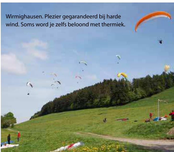
Wirmighausen. Plezier gegarandeerd bij harde wind. Soms word je zelfs beloond met thermiek.

naam al doet vermoeden – het idee krijgt dat Orks en Hobbits elk moment tevoorschijn kunnen komen. Langs de rivier ligt het traditionele dorp Elkeringhausen. Dat elk huis hier met dezelfde kleur gevel en dak is uitgevoerd valt misschien niet direct op, maar dit feit is vanuit de lucht niet te missen. Om boven het dorp te kunnen vliegen, moeten wel eerst wat hoogtemeters geklommen worden, te voet ja... Driehonderd meter om precies te zijn. Misschien dat daarom de Rössberg eigenlijk al jarenlang niet meer bevlogen wordt. De wandelroute begint bij de brug over de Orke in het plaatsje Elkeringhausen. De laatste zeventig hoogtemeters naar de startplek zijn zo steil als een zwarte piste, maar eenmaal boven ligt een ruime maar niet onderhouden natuurstartplaats te wachten. Een beetje wind uit het westen is ideaal, om makkelijk over de bomenrij weg te komen. In de tweede helft van de middag kan het hier goed thermisch zijn, en bij stevigere westenwind kan gesoard worden. Landen is een eitje op de enorme grasvelden ten noorden van het dorp. Probeer dicht langs het smalle autoweggetje te landen om zo min mogelijk over het weiland te lopen, vooral als het gras aan een maaibeurt toe lijkt te zijn. Tip: Een hike&fly met sneeuw in de winter is hier een sprookjesachtig mooie belevenis.