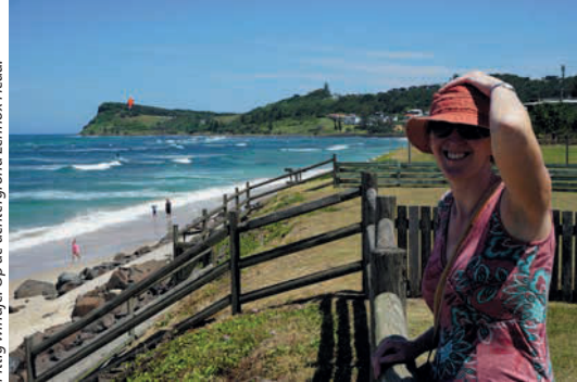
Pittig windje! Op de achtergrond Lennox Head.