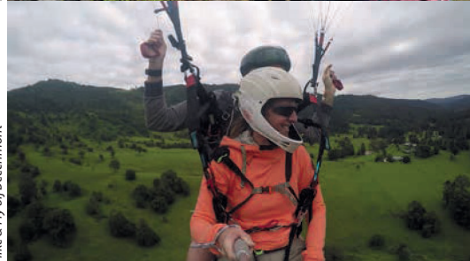
Hike & Fly bij Beechmont