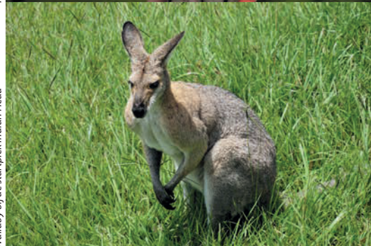
Wallaby bij de startplek Indian Head