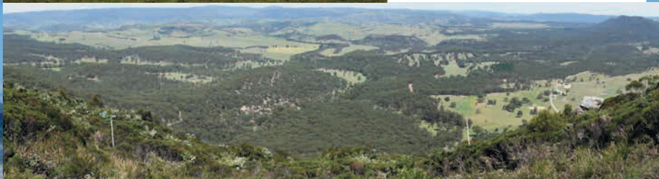
Blackheath, prachtige startplek in de Blue Mountains

volkstelling. Het is genoemd naar het regenboogkleurige zandduin rondom het plaatsje. De legende beschrijft hoe de regenboog god Yiningie ten strijde trok tegen een lokale stambewoner. Uiteraard was er ruzie om een vrouw. De regenboogman kwam te kort en spatte uit elkaar tegen de duinen. Een meer wetenschappelijke benadering voor de kleurenpracht is dat mineralen de kleur aan het zand geven. De kleuren zijn geëxporteerd naar China en veel is er niet meer van te zien. Dat hoeft ook niet, want hier kom je niet om naar kleuren te kijken maar om met een 4wd over het strand te crossen of om hoog boven de duinen te hangen. De startplek is honderd meter hoog, het duin zelf tweehonderd meter hoog en op een goede dag kan je hier tien kilometer vliegen met paragliders of delta's.