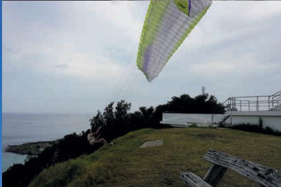
Starten vanaf Hill 60