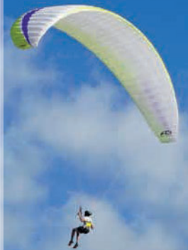
Spelen bij Rainbow Beach

Het Dune du Pylat van Australië! Wagga... met je blote poten door het zand, tot het zand diep in je lichaam zit. Beter kan het niet en beter wordt het ook niet naar het noorden, dus blijf hier spelen tot je visum verloopt of langer!