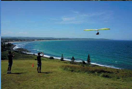
Voor fans van harde wind, Lennox Head