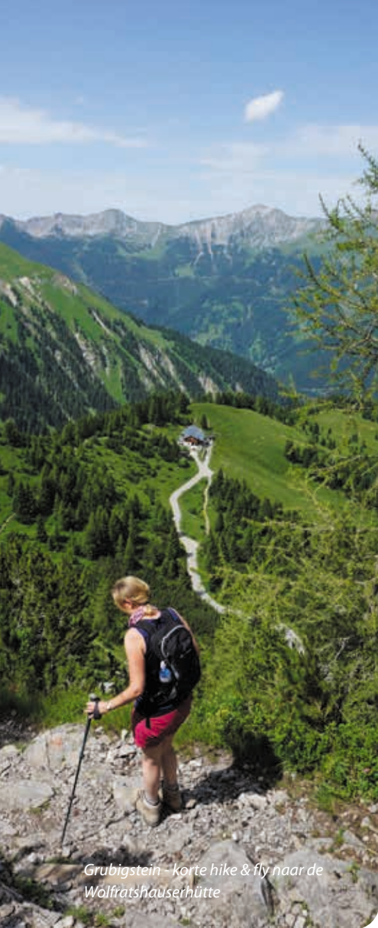
Grubigstein - korte hike & fly naar de Wolfratshäuserhütte

een windvaan, dus niet te missen onderweg naar de top. Je pakzak kan je hier alvast afwerpen als je nog een blik vanaf het hoogste punt wilt werpen. Start bij de startplaats een beetje aan de rechterkant, kijkend naar het dal, want daar is de helling het mooist. De omstandigheden zijn hier ook vaak later op de dag op zijn best, als je kunt soaren op de valleiwind. Landen kun je op het grote landingsveld van Bichlbach.