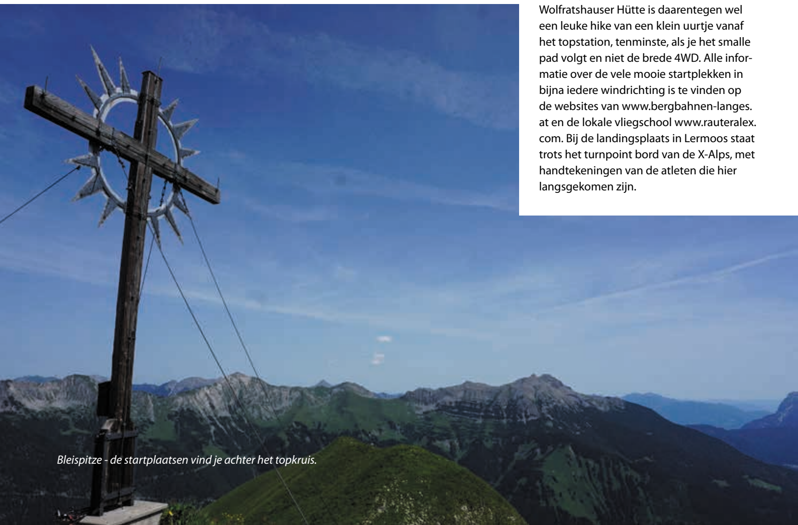
Bleispitze - de startplaatsen vind je achter het topkruis.

De Grubigstein is een berg voor alles. Behalve rotsklimmen en klettersteigen, kan je op deze berg alle bergsporten beoefenen. De berg lijkt vastgeketend onder een net van kabelbaantjes. Hoewel er talloze hike & fly opties zijn, kunnen de meeste startplaatsen op de Grubigstein eenvoudig met de kabelbaan bereikt worden. Zelf vind ik dit een heerlijke berg om nog even een cablecar & fly tochtje te maken na een spannende hike & fly. De startplek bij de romantische Wolfratshauser Hütte is daarentegen wel een leuke hike van een klein uurtje vanaf het topstation, tenminste, als je het smalle pad volgt en niet de brede 4WD. Alle informatie over de vele mooie startplekken in bijna iedere windrichting is te vinden op de websites van www.bergbahnen-langes.com en de lokale vlietschool www.rauteralex.com . Bij de landingsplaats in Lermoos staat trots het turnpoint bord van de X-Alps, met handtekeningen van de atleten die hier langsgesproken zijn.