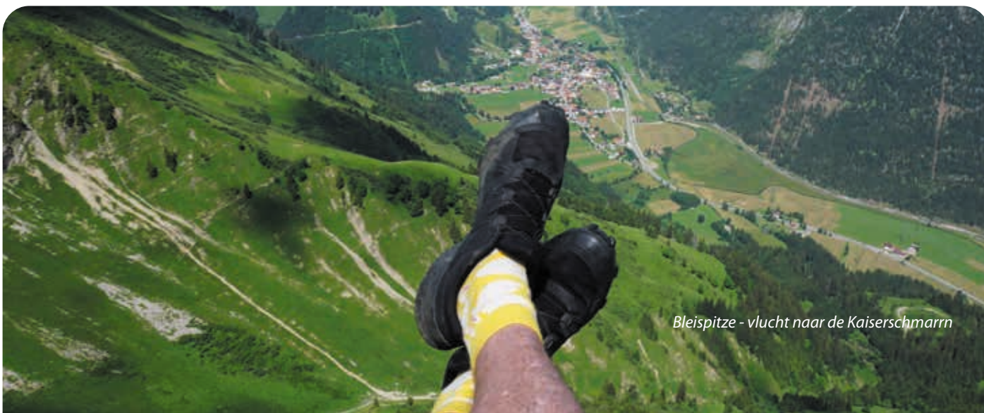
Bleispitze - vlucht naar de Kaiserschmarrn