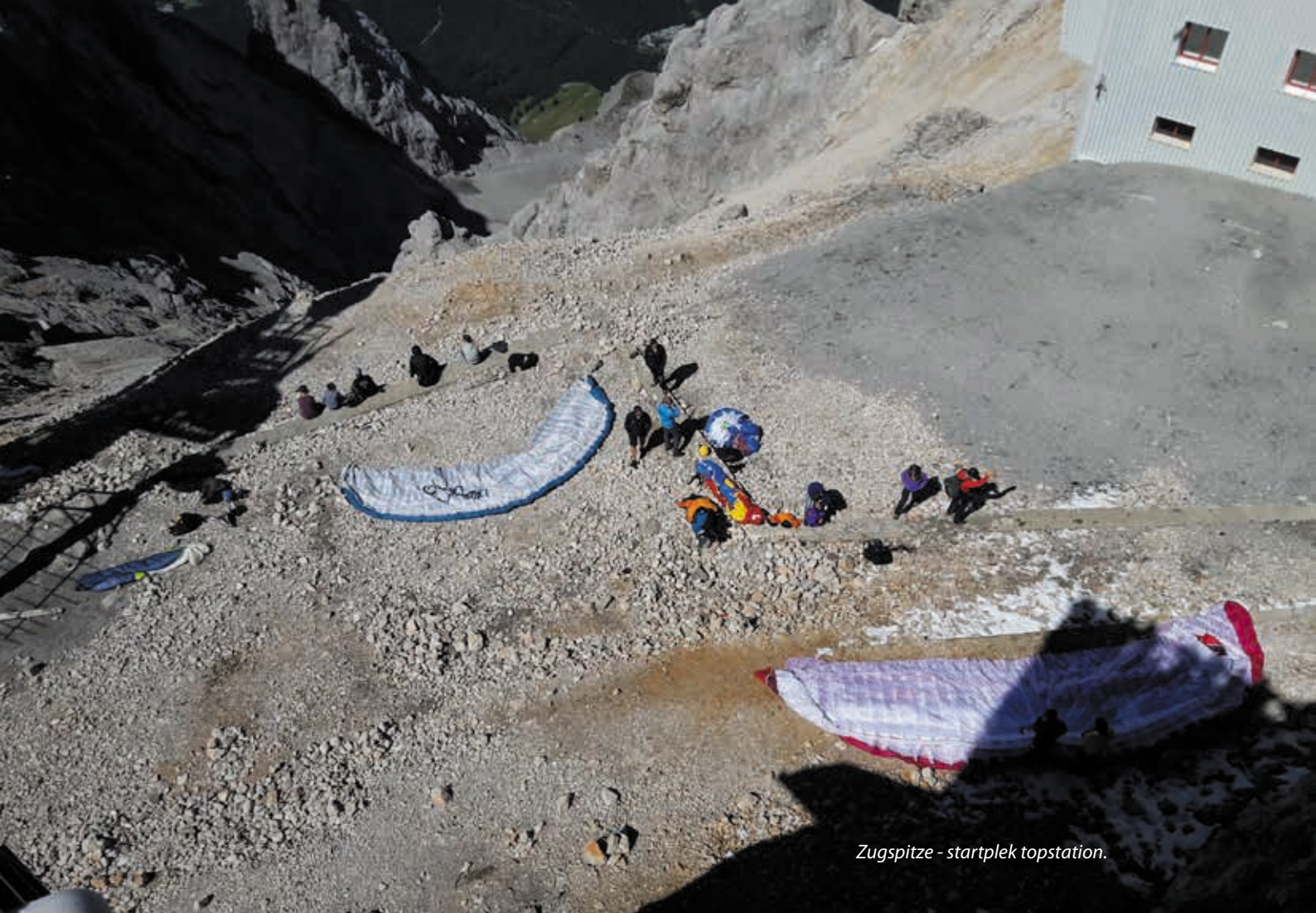
Zugspitze - startplek topstation.