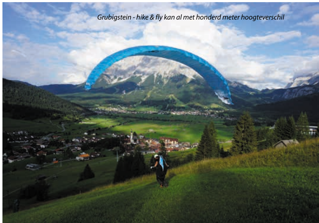
Grubigstein - hike & fly kan al met honderd meter hoogteverschil

ook bij het dalstation van de kabelbaan starten, maar dat is niet zo motiverend met die gondels boven je hoofd terwijl je loopt te zweten. Je ontkomt er sowieso niet aan om een paar keer de kabelbaan te kruisen, en uiteindelijk kom je bij het bergstation uit. Hier meng je je met de gondeltoeristen en volg je de laatste tweehonderd hoogtemeters naar het topkruis van de Alpkopf. De startplek ligt hier vlakbij en is voorzien van