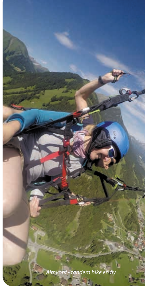
Almkopf - tandem hike en fly

De Zugspitze is met 2962 meter hoogte net geen drieduizender maar wel de hoogste berg van Duitsland. De berg ligt op de grens met Oostenrijk. Aan de zonnige zijde van deze indrukwekkende rots liggen zeven charmante plaatsjes in het Tirolse grensgebied Ehrwald, Lermoos, Berwang, Biberwier, Bichlbach, Heiterwang am See en Namlos. Het gebied is ingericht op skiërs, bergwandelaars, klimmers en mountainbikers. Dat de omgeving zich ideaal leent voor Hike & Fly avonturen op verschillende niveau's is nog een goed bewaard geheim. Niet doorvertellen dus, maar hier volgt een overzicht van de mooiste tochten.