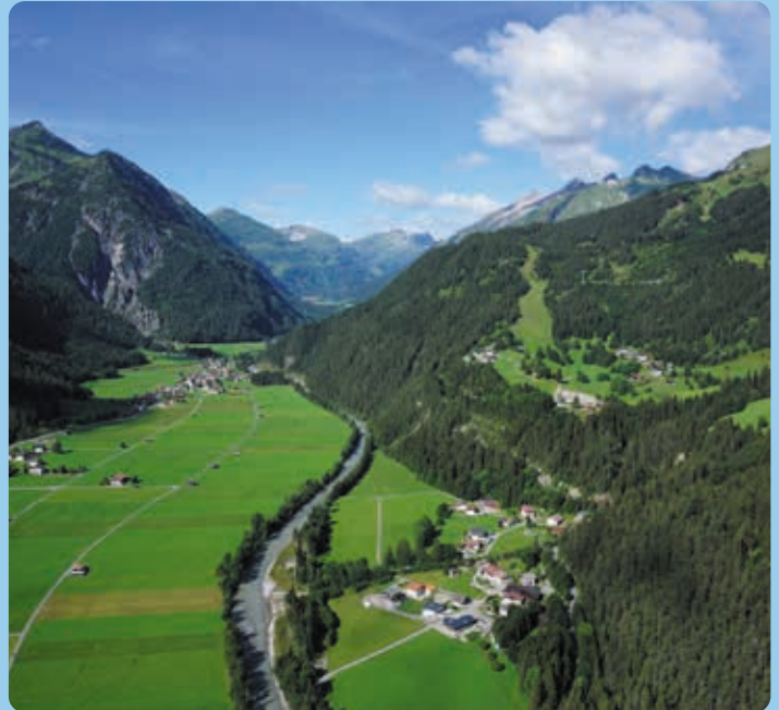
Uitzicht door het Lechtal.

www.onair-paragliding.com/service/flugwetter