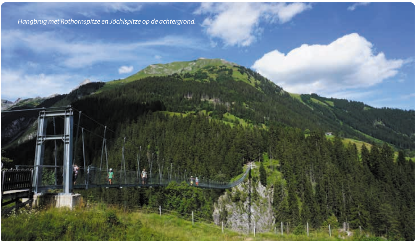
Hangbrug met Rothornspitze en Jöchlspitze op de achtergrond.