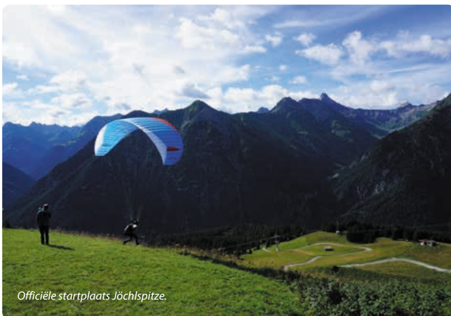
Officiële startplaats Jöchlspitze.