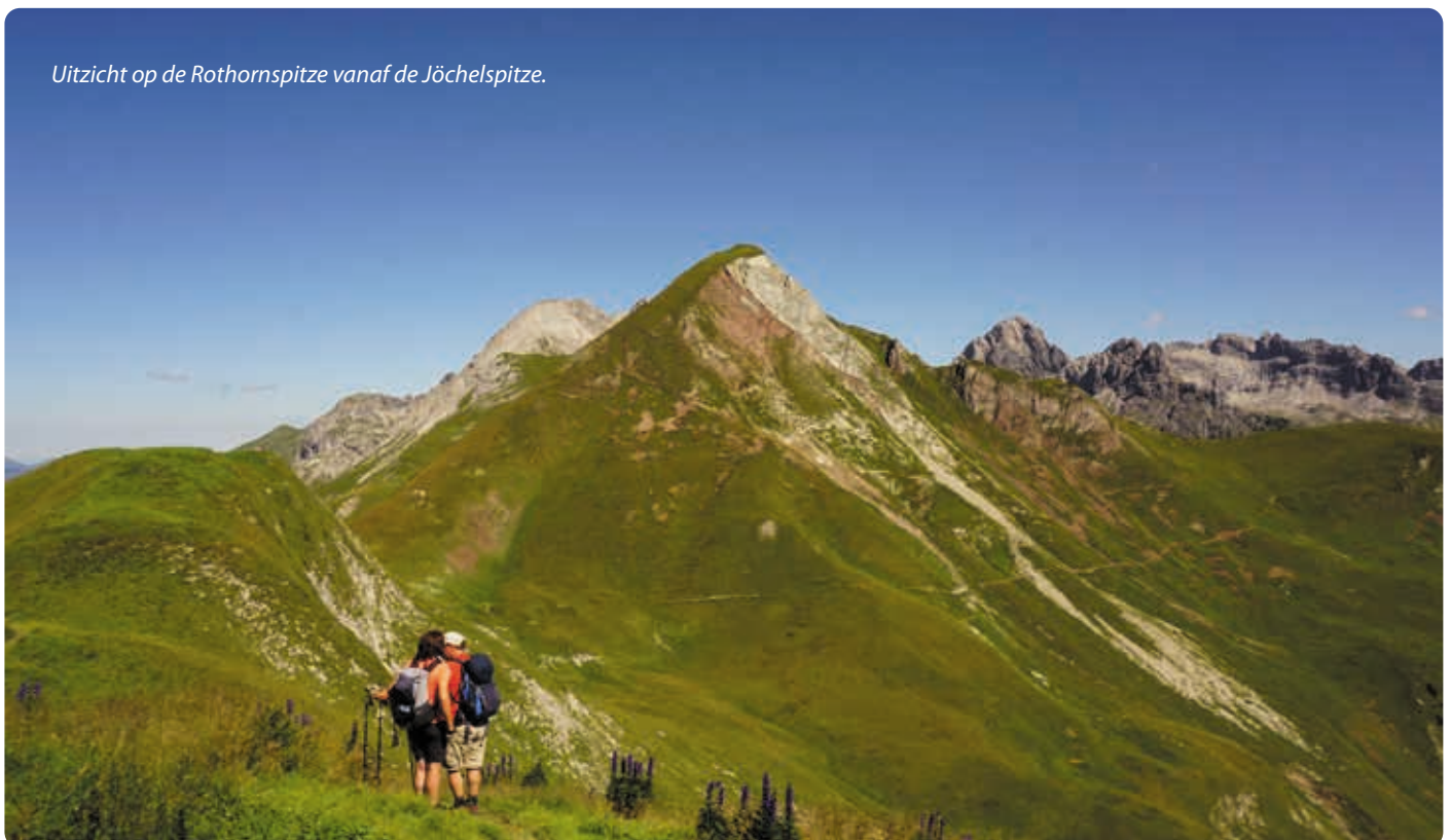
Uitzicht op de Rothornspitze vanaf de Jöchelspitze.