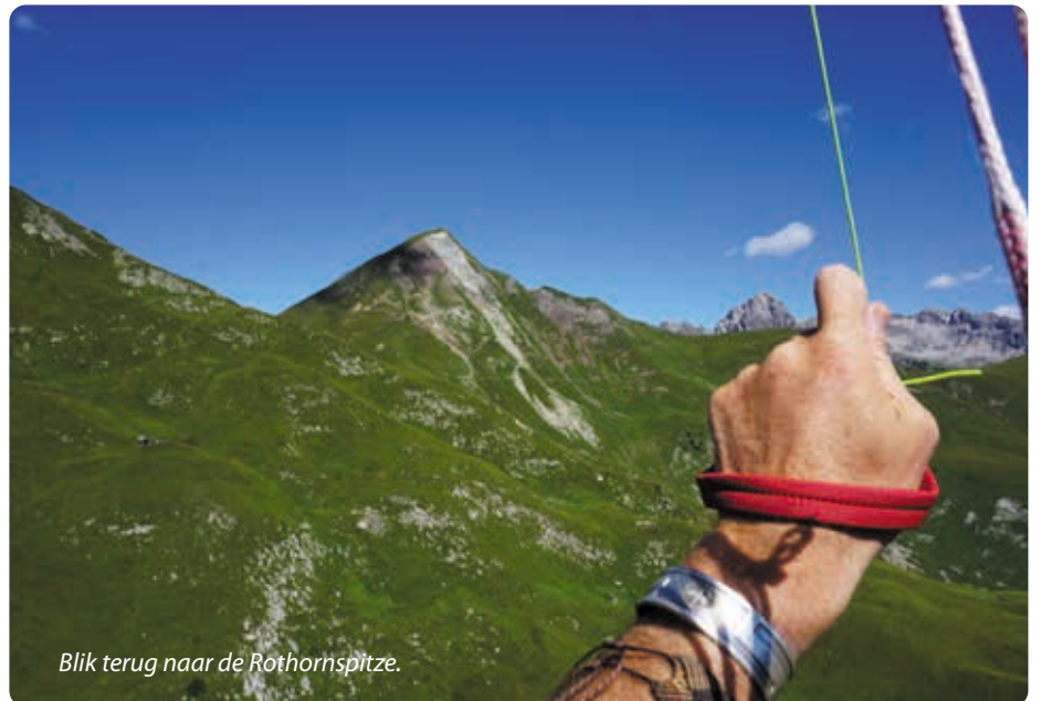
Blik terug naar de Rothornspitze.

Puristen kunnen de tocht beginnen in het dal en naar het topstation van de Jöchlspitze klimmen. Als je dit onderdeel met de kabelbaan doet, blijft er evengoed nog genoeg over aan avontuur en hoogtemeters om de Rothornspitze te bereiken. Vanaf de kabelbaan is het sowieso nog een klein uur klimmen naar de Jöchlspitze, naar keuze via het steile pad of de "toeristische" variant over de alpiene leerweg, langs de hoofdstartplaats (SP 02a) en via het berghooi museum. Alle wegen leiden naar het niet kinderachtig vormgegeven topplateau met imposant topkruis van de Jöchlspitze. Voor experts met kleine eenvoudige schermen is hier bij geschikte wind een klein maar uitnodigend startplaatsje in hoog gras richting het zuiden (SP02b). Vanaf hier is ook de Rothornspitze al zichtbaar, met haar opvallende half witte/half rode rotswand. Daar starten is veel leuker en meestal eenvoudiger. Volg het pad nu eerst even omlaag, naar het Rothornjoch. Vanaf hier verlaat je de gebaande paden en kies je je eigen weg, de tweehonderdvijftig meter hoge imposante graspiramide op. Halverwege de flank kom je vrijwel zeker een pad tegen dat je een tijdje goed kunt volgen. Vlak voor je bij het sobere houten topkruis komt, kruis je een redelijk vlak kaal plateau, wat een ideale