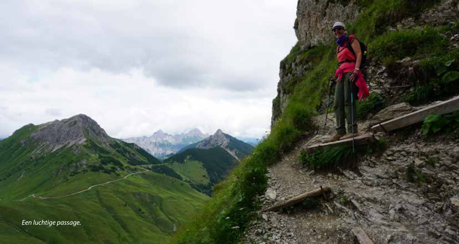
Een luchtige passage.

drie kwartier klimmen is naar de top. De omgeving van Tannheim kwam afgelopen jaar als winnaar uit de bus voor Europa's mooiste wandelgebied, maar van looptijden aangeven bakken ze niets. Het kostte mij één kwartier in plaats van drie kwartier om het topkruis aan te tikken. Onderweg naar het topkruis openbaren zich – geruststellend – steeds meer startmogelijkheden.