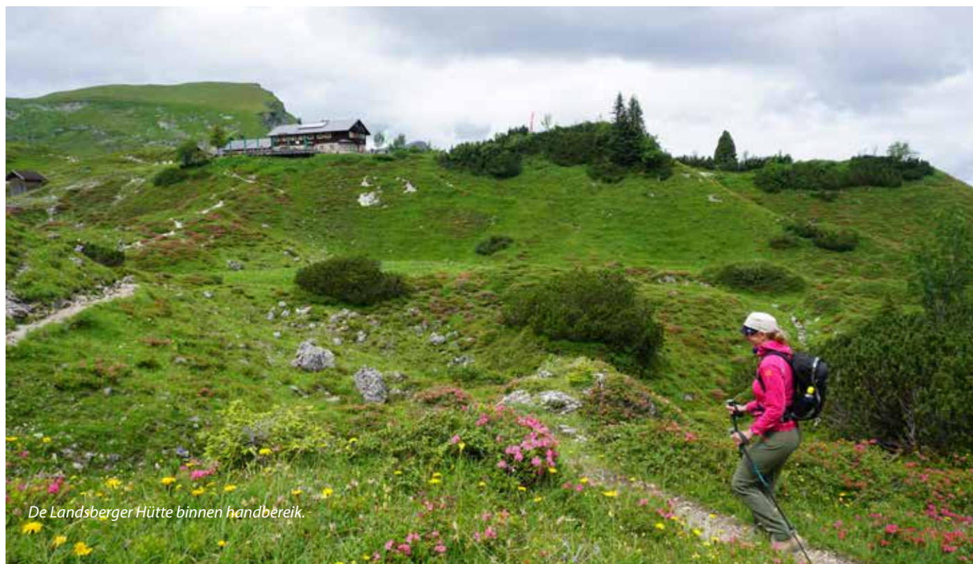
De Landsberger Hütte binnen handbereik.

de hoogtemeters, daalt het pad weer wat af naar Gappenfeldscharte. Vlak naast de scharte ligt de Gappenfeldalm, een hut waar je nog even kan bijtanken en moed kan verzamelen voor de slotbeklimming van de Sulzspitze. Het hoogteverschil is nog nauwelijks tweehonderd meter, maar de rotsachtige top ziet er bijna onneembaar uit. Laat staan dat je daar goede startmogelijkheden verwacht. Een bordje aan het begin van het smalle steile paadje geeft aan dat het nog