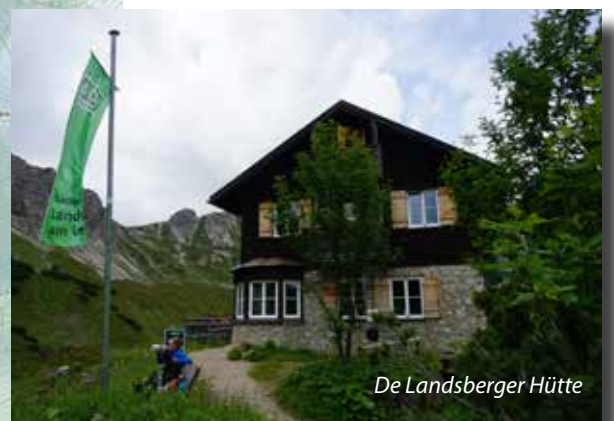
De Landsberger Hütte

Landsberger Hütte: 47.44415°, 10.51457° (1.810 m) Startplaats op de Sulzspitze: 47.46315°, 10.53642° (2.038 m)