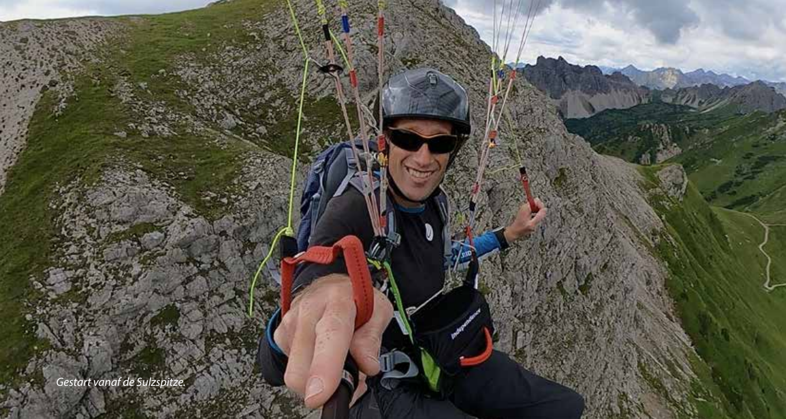
Gestart vanaf de Sulzspitze.