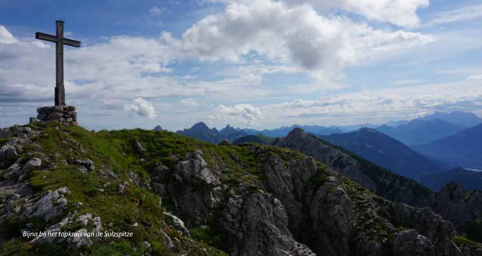
Bijna bij het topkruis van de Sulzspitze

de Untere Traualpe en vervolgens omhoog, de bordjes volgend naar de Landsberger Hütte. Na vijfhonderd hoogtemeters stijgen kom je bij de Obere Traualpe, consumptie verplicht! Zorg dat je er weer tegen kunt om de laatste honderdvijftig hoogtemeters naar de Landsberger Hütte (1805 m) af te leggen. Liefhebbers van bergmeertjes en panorama's komen op deze route volledig aan hun trekken, ook al is de Traualpsee eigenlijk een stuwmeertje.