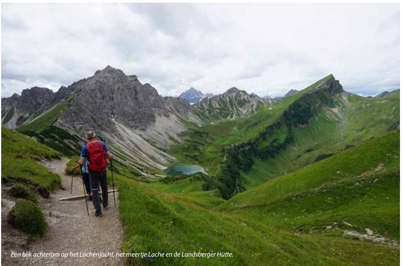
Een blik achterom op het Lachenjocht, het meertje Lache en de Landsberger Hütte.

De mooiste route, waarbij je zonder mechanische hulpmiddelen de hut bereikt, begint bij de Vilsalpsee. Dit landschappelijk aantrekkelijke meertje aan het eind van het zijdal van het Tannheimer Tal ligt in een natuurbeschermingsgebied en is beperkt voor auto's toegankelijk (alleen vroeg en laat op de dag). Vanaf het dalstation van de kabelbaan loop je in drie kwartier naar de Vilsalpsee en kan je de auto bij de landingsplek laten staan. Het is lekker om zo over het vals plat warm te lopen naar de horecagelegenheden aan de oever van het meer. Nee, dit zijn geen berghutten dus een consumptie mag je nog overslaan. Maar vanaf hier begint het echte werk. Je loopt langs de oever van het meer een kwart met de klok mee tot